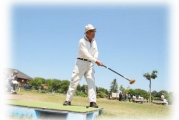
シニア(壮年) スポーツ教室