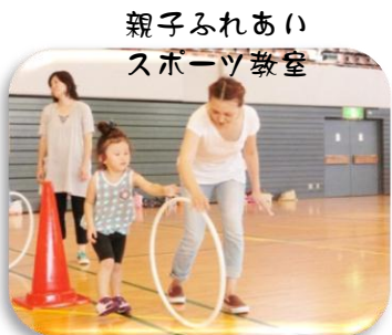
親子ふれあいの スポーツ教室