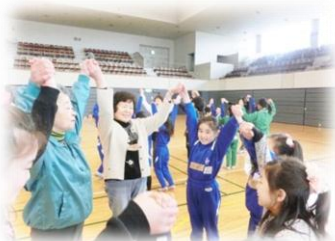
コーディネーション トレーニング教室

トランポリンやミニアスレチックで家族でスポーツ☆ どなたでもご参加頂けます。 詳細は塩釜ガス体育館まで