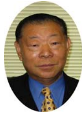
特定非営利活動法人 塩釜市体育協会