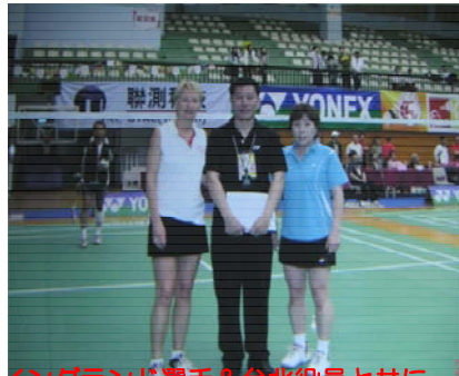
イングランド選手&台北役員と共に

おおよそ体育施設があるはずもない街中に位置する台北市総合体育館には、世界20ヶ国から集まった選手のうち、日本は前回のマレーシア大会35名を上回る56名が参加。バドミントン普及のため世界レベルの選手に参加を呼びかけた為、元国家代表クラス選手が集結し、更にレベルアップ。しかし意外にもトップ選手を相手に無名選手が力を発揮し、打ち負かしてしまう場面もありと、熱戦が繰り広げられました。そんな中、日本代表は23個のメダル獲得という輝かしい成績を修めました。