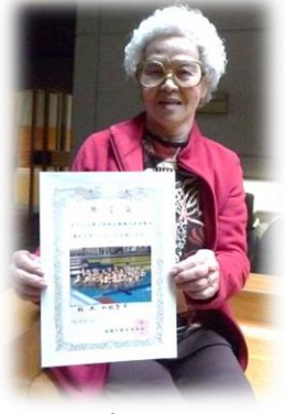
温水プールの第1回初心者婦人水泳教室にも参加しました。

塩釜ガス体育館の「3B体操教室」に、第一回から参加しています。色々な人とおしゃべりをしながら体操するのでとても楽しく、時間があっという間に過ぎてしまいますね。 私は小さい頃から、花柳流の日本舞踊や習字など、幅広く色々なものを習ってきました。最近ではデコパージュやカントリーダンスにも挑戦したり、市の女性セミナーにも参加したりと、とにかく「やりたい」と思ったら、まず挑戦してみます。 実は二〇代の頃に普通免許も取得したんですよ。一番最初に乗った車はコルト六〇〇。真っ赤なシートで素敵な車でした。 当時は女性が普通免許を取得するなんて、本当に珍しいことでしたが、それのおかげで、主人の通院の送迎に役立ちました。 これからも面白そうと思ったものには、どんどん挑戦していきたいと思っています。