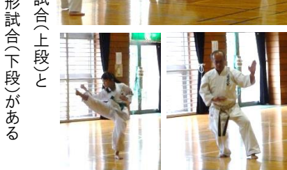
空手には組手試合(上段)と形試合(下段)がある

塩釜ガス体育館には、ツツジをはじめ、たくさん植え込みがあります。体協六十周年記念式典で植樹された、山モミジやサザンカも元気に大きく育ちました。 しかし、成長すると心配になるのは、枯れたり病気になったりすることです。 皆さん、最近、体育館屋外のモニュメント周辺の花壇や南側駐車場に向かう花壇など、広範囲にわたって綺麗になったなと思うことはありますか？ 実はこれ、平成二十八年三月十五日に、塩釜市シルバー人材センターの十二名の方が研修会として行った剪定作業のおかげです。