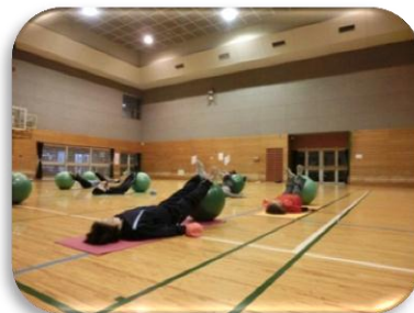
からだ改善エクササイズ