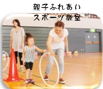
親子ふれあいのスポーツ教室

トランポリンやミニアスレチックで家族でスポーツ☆ どなたでもご参加頂けます。 詳細は塩釜ガス体育館まで