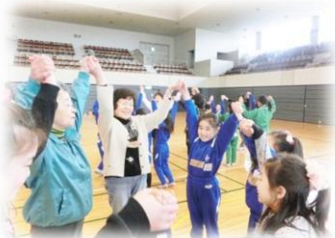
コーディネーショントレーニング教室