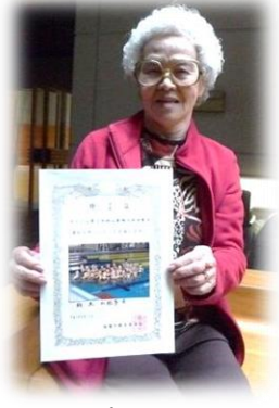
温水プールの第1回初心者婦人水泳教室にも参加しました。

塩釜ガス体育館の「3B体操教室」に、第一回から参加しています。色々な人とおしゃべりをしながら体操するのでとても楽しく、時間があっという間に過ぎてしまいますね。 私は小さい頃から、花柳流の日本舞踊や習字など、幅広く色々なものを習ってきました。最近ではデコパージュやカントリーダンスにも挑戦したり、市の女性セミナーにも参加したりと、とにかく「やりたい」と思ったら、まず挑戦してみます。 実は二〇代の頃に普通免許も取得したんですよ。一番最初に買った車はコルト六〇〇。真っ赤なシートで素敵な車でした。 当時は女性が普通免許を取得するなんて、本当に珍しいことでしたが、それのおかげで、主人の通院の送迎に役立ちました。 これからも面白そうと思ったものには、どんどん挑戦していきたいと思っています。